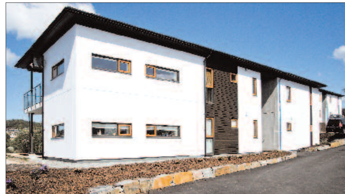
På Skarholmen på Askøy har SE-Arkitektur tegnet og Backer Entreprenør bygget fem bygg med 17 leiligheter for Backer Bolig.

Sorteringsgraden for byggavfall er på ca 60 prosent. Nysæther Kristiansen sier at både Backer Bolig og Backer Entreprenør gjennom dette prosjektet har fått økt kompetanse på boligbygging. – Vi har blant annet lært å ikke undervurdere tidsforbruk knyttet til kundedialog på dette med skreddersøm av leilighetene. For fremtidige boligprosjekter vil vi ha et langt mer aktivt forhold til