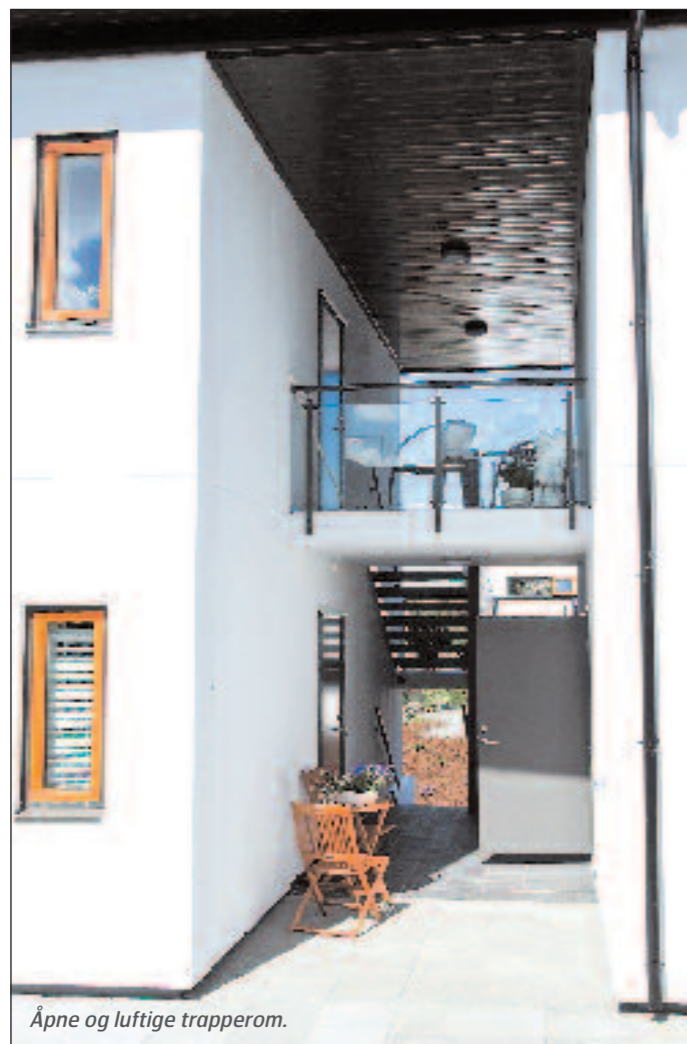
Åpne og luftige trapperom.

Med kubiske former, hvitmalte betongvegger med mørkebrune kontraster og oransje på vinduene gir boligprosjektet Engevikken på Askøy assosiasjoner til bygg på solfylte greske øyer.